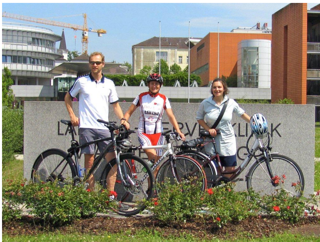
Team 1 der gespag