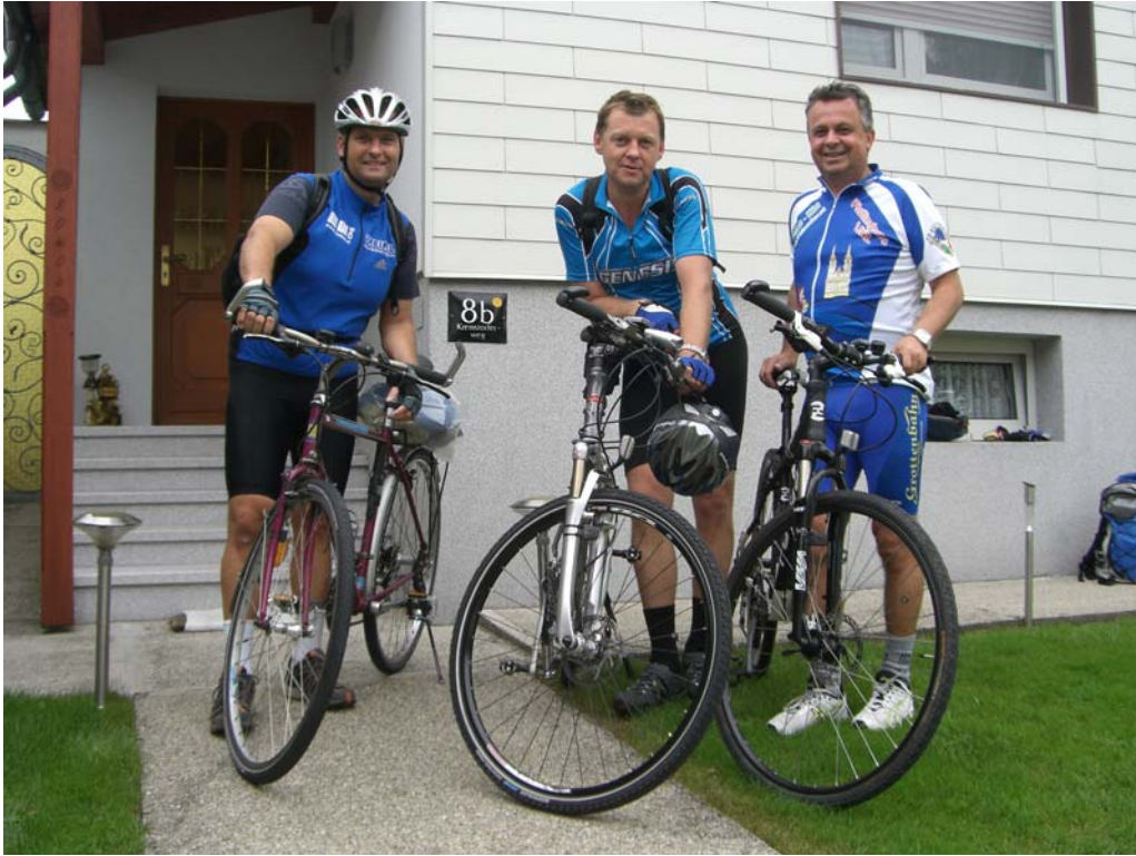
„Die 3 lustigen Remisenradler“ der Linz AG