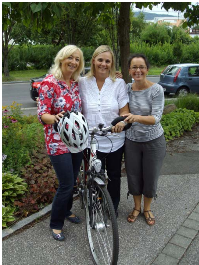
Die „Dornacher Radler“ (Seniorenzentren Linz)