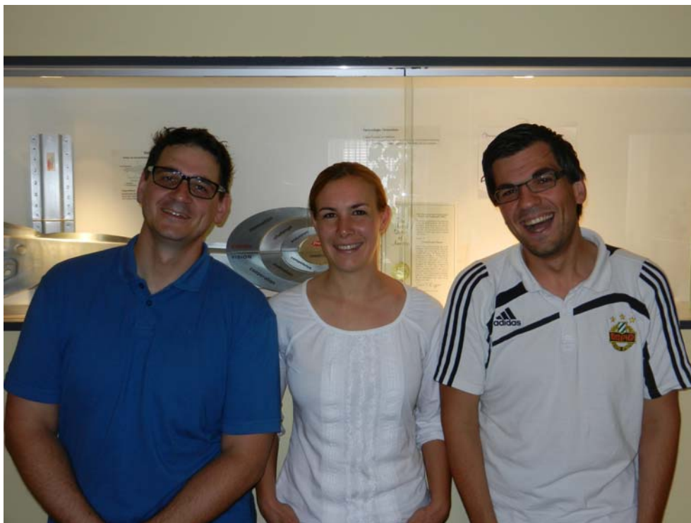
Team „Die Erfinder“ (voestalpine)