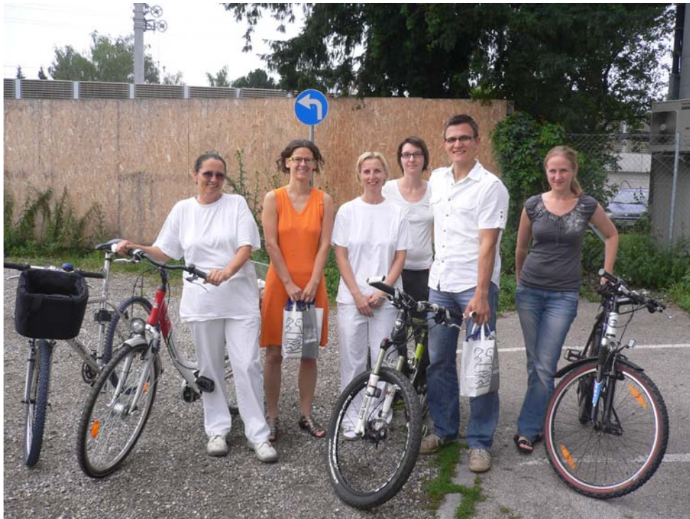
Einige RadlerInnen der Fa. NESTLÉ