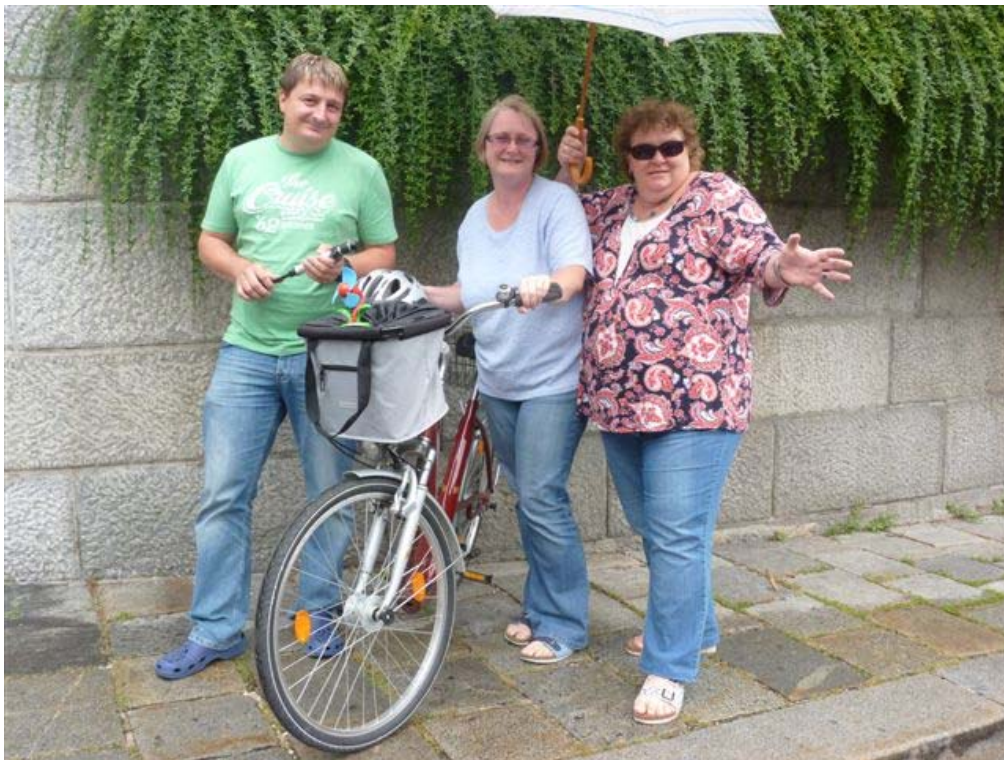
Team „Donaufplitzer“ (Magistrat Linz)