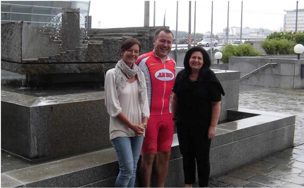
Team „Social Assistance on Tour“ (Magistrat Linz)