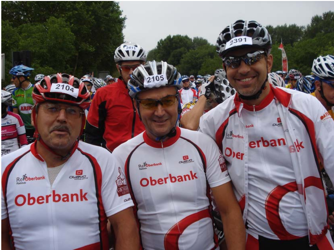
Team „Mühlviertler Granitradler“ (Oberbank)