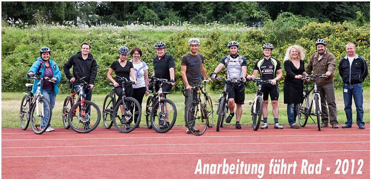
VA Anarbeitung GmbH (voestalpine)